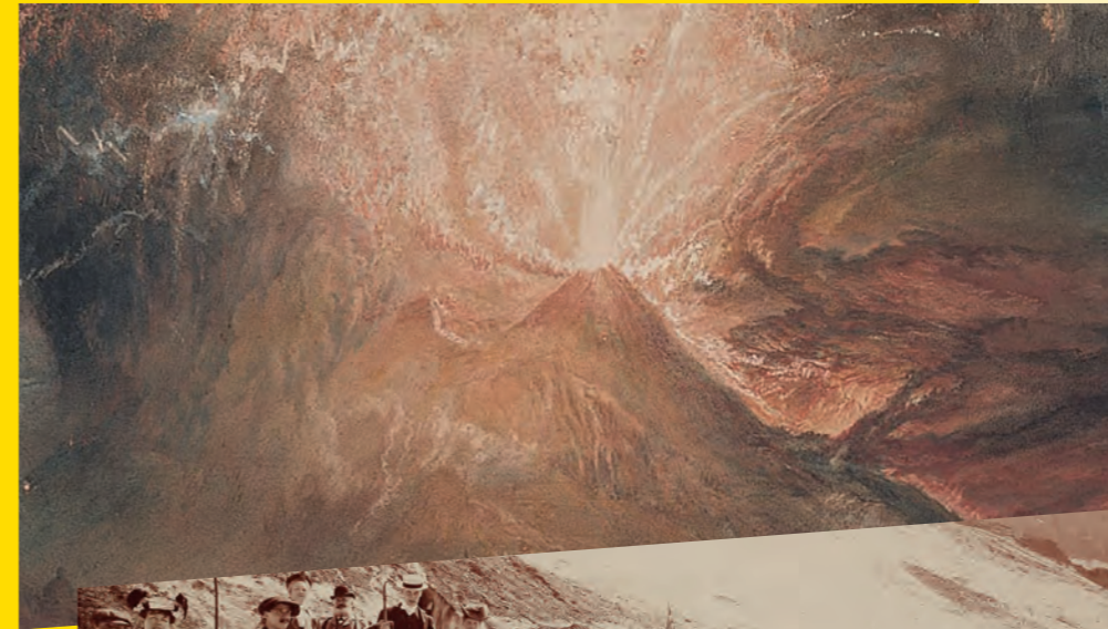
← Ausbruch des Vesuvs Gemälde von William Turner, 1817. Grosse Vulkanausbrüche können globale Fernwirkungen auf Klima und Gesellschaft haben. Yale Center for British Art, New Haven