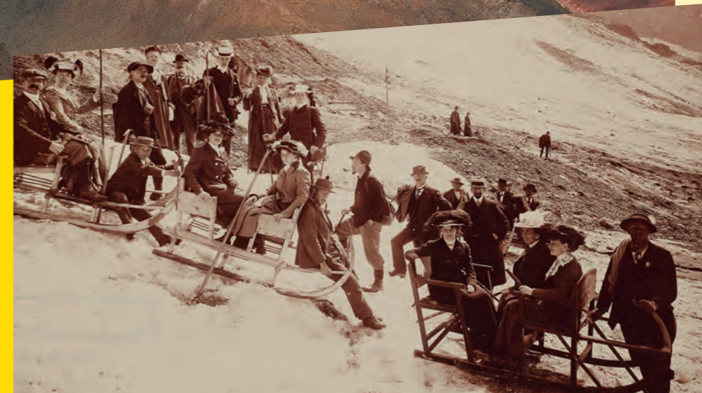
↙ Grossbürgerliche Touristinnen und Touristen auf dem Eigergletscher unweit der gleichnamigen Bahnstation Foto: Arthur Gabler, 1898, Nr. 7636. © Bern, Museum für Kommunikation, Fotografisches Atelier Gabler, GAB_4140